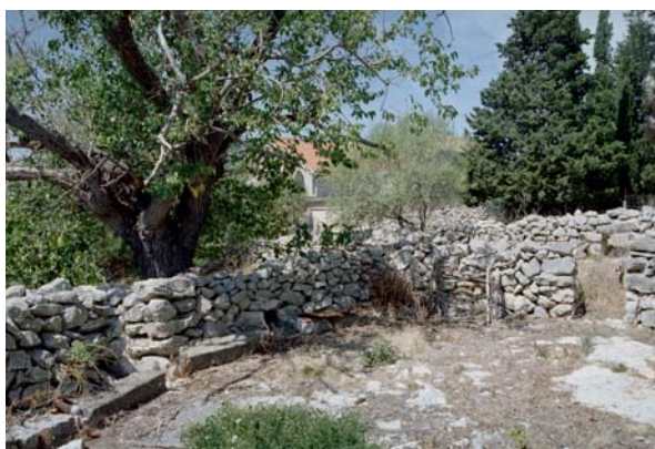
Pogled iz velikog osika na njegov ulaz iz srednjeg osika i na samorašnji kočić . U pozadini cesta i kuće u Dudićima.