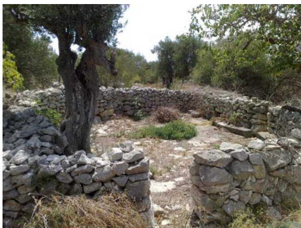
Pogled na veliki osik iz samorašnjeg kočića .